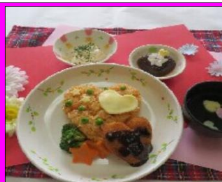
バレンタイン昼食

2月14日バレンタイン昼食のメニューは、チキンライス、ハートのコロッケ、スパゲッティサラダ、コンソメスープ、ハートのプリンでした。