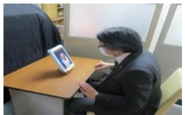
(実際の面会のご様子)